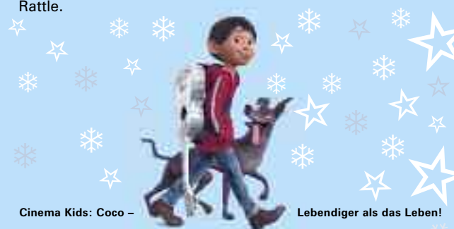
Cinema Kids: Coco –

31.12.17, 17 Uhr, Silvesterkonzert der Berliner Philharmonie , Live-Übertragung Silvester feiern mit der Berliner Philharmonie und der Mezzosopranistin Joyce DiDonato unter der Leitung von Sir Simon Rattle.