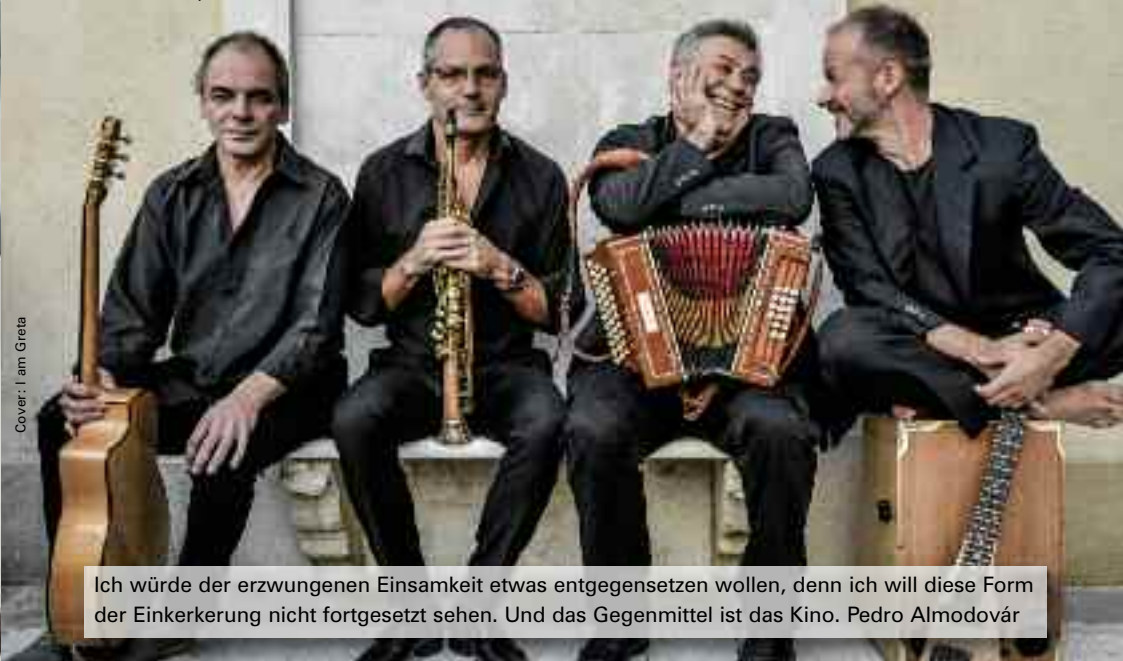
Cover: I am Greta

Ich würde der erzwungenen Einsamkeit etwas entgegengesetzt wollen, denn ich will diese Form der Einkerkung nicht fortgesetzt sehen. Und das Gegenmittel ist das Kino. Pedro Almodóvar