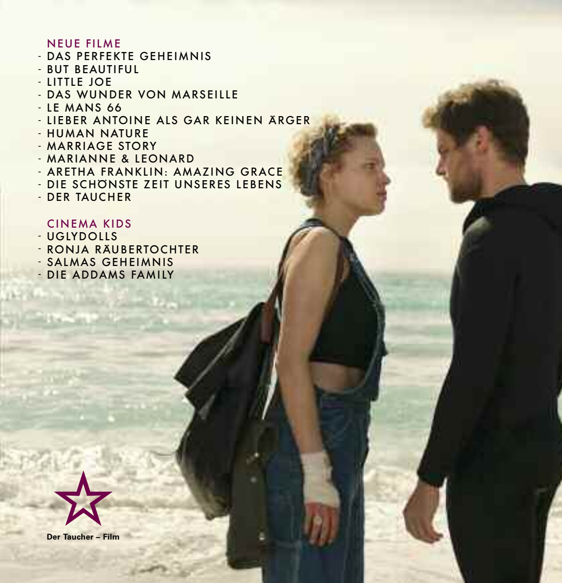
Cover: Das Wunder von Marseille