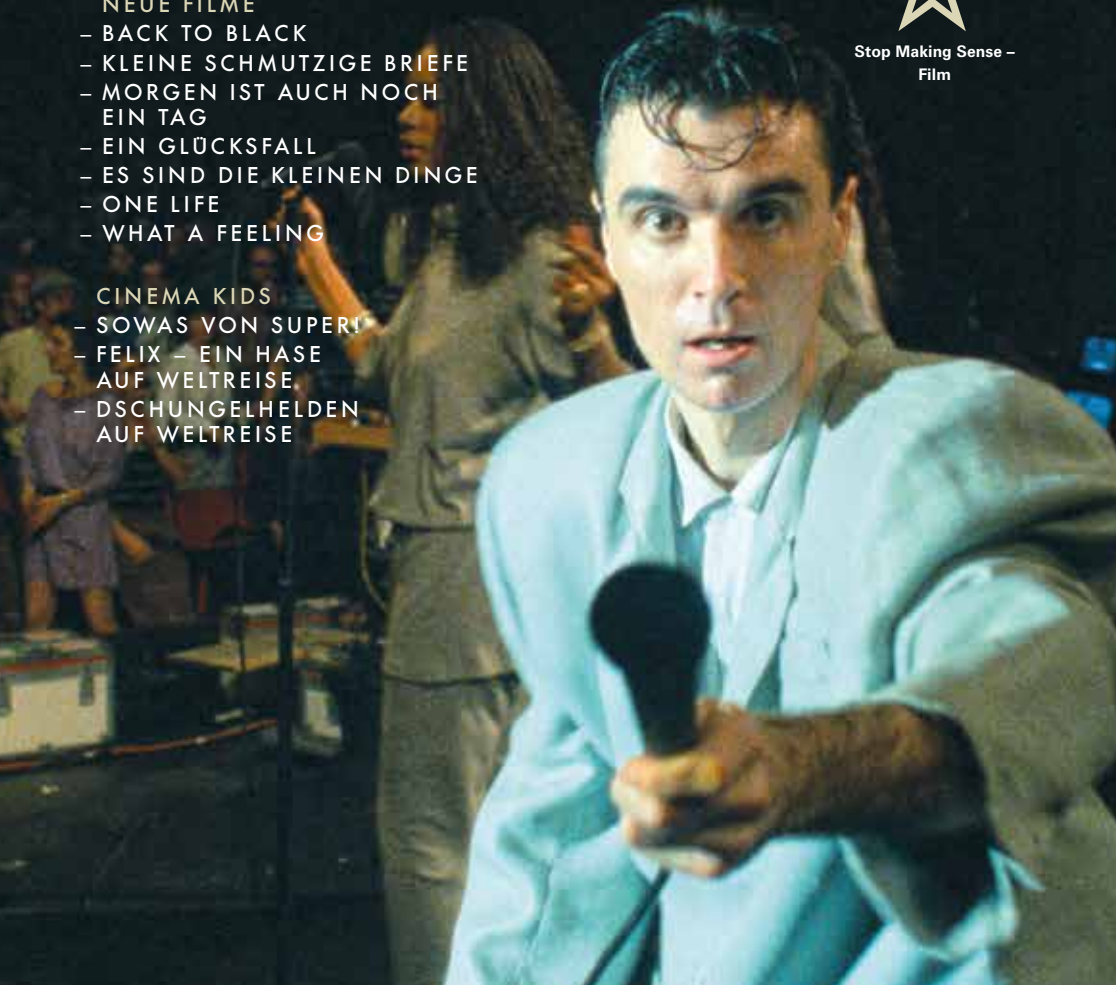
Cover: Morgen ist auch noch ein Tag