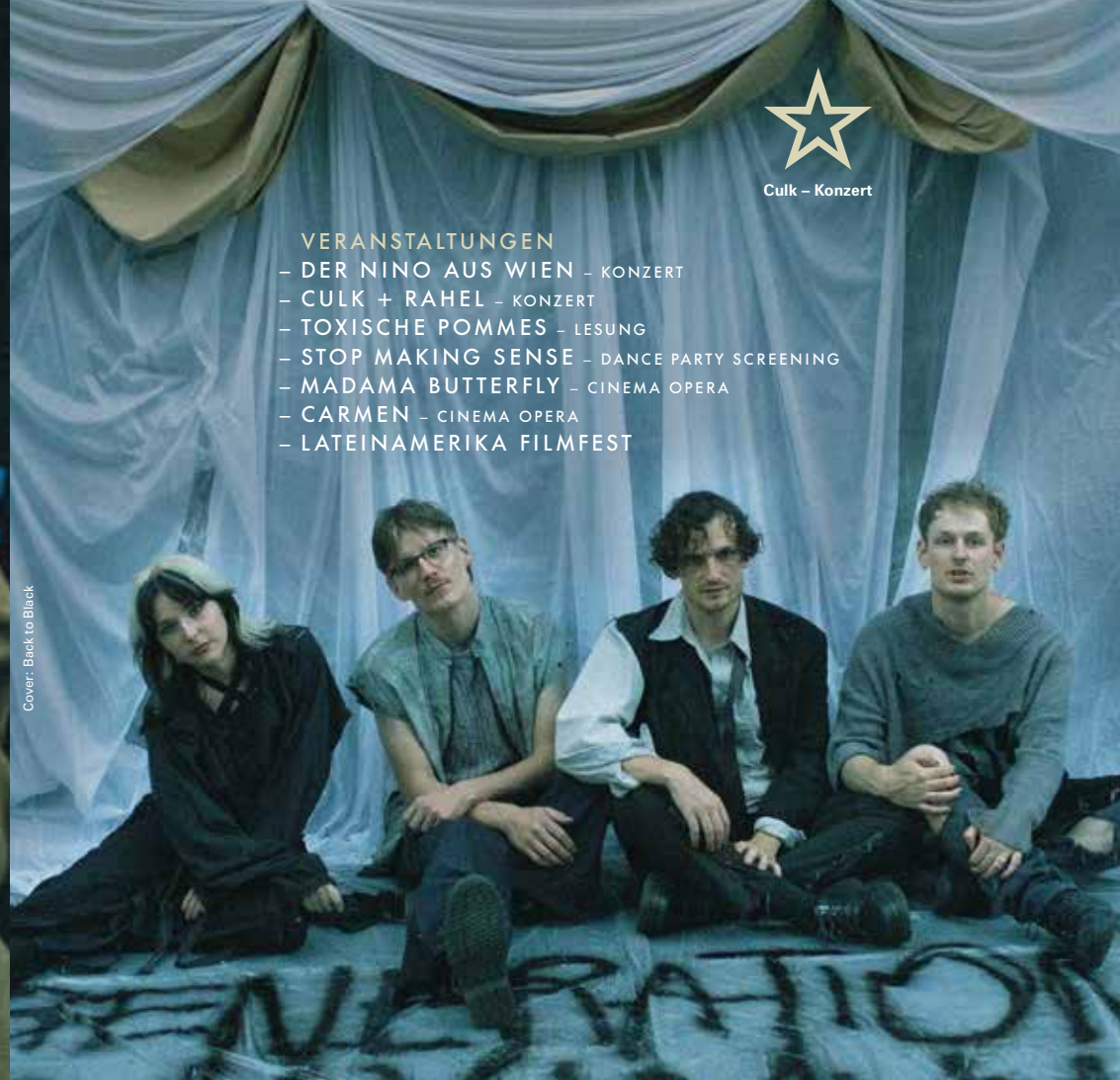
Cover: Back to Black